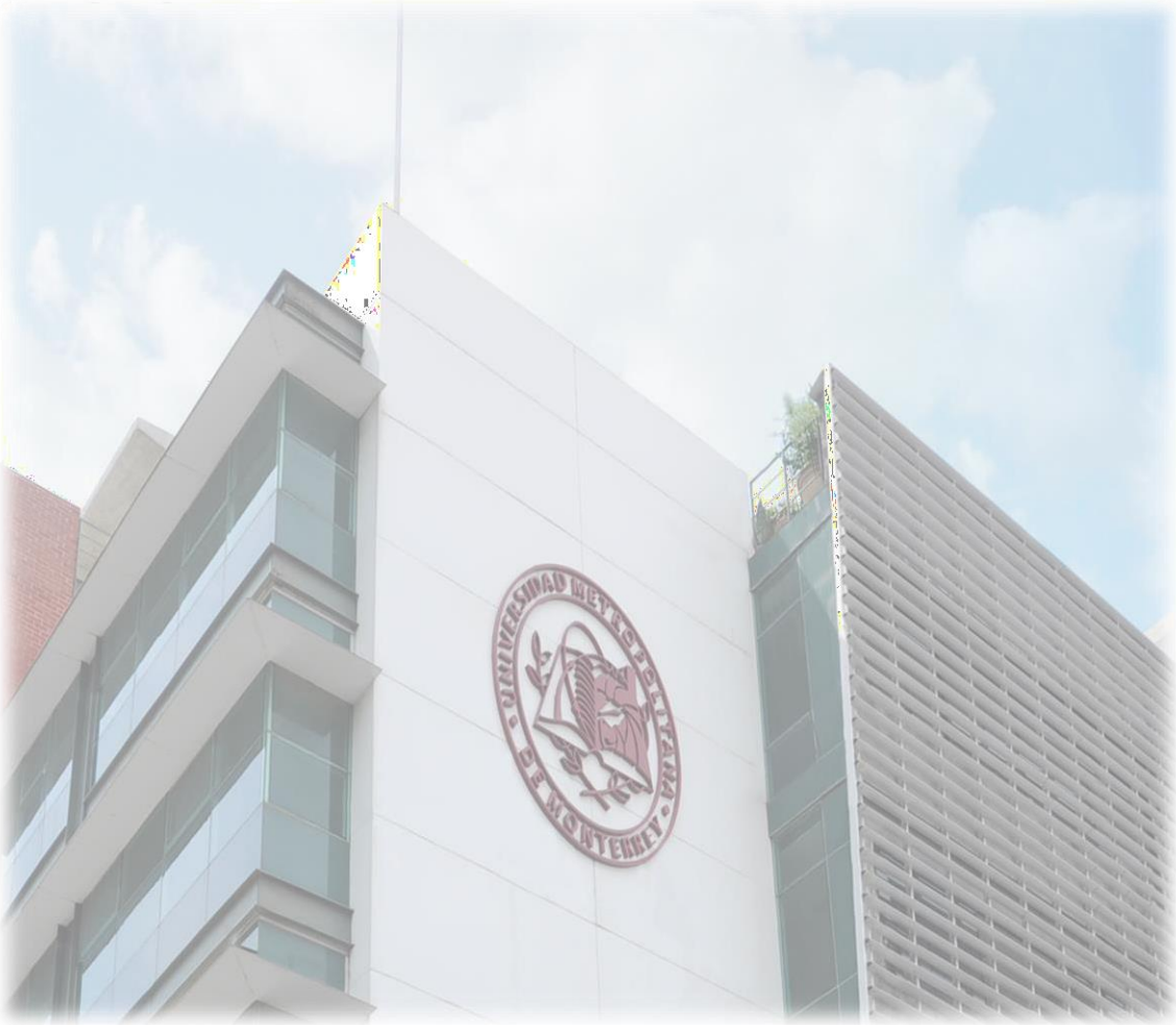
Monterrey, Nuevo León a agosto de 2024.